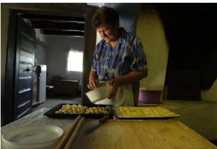
Készül a sütemény a Gazdaházban