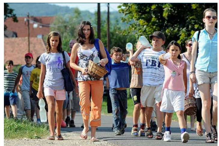
Árvízkárosult gyerekek Hernádnémetiből