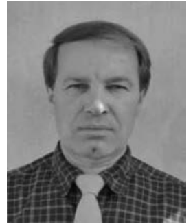
Bóta Géza polgármester

Kedves Noszvajiak! Engedjenek meg egy kérést: az október 3-i választásra – bárkire is szavazzanak, mint képviselő, vagy polgármester - jöjjenek el, mert az egész falunak kell döntenie, nem csak a felének. Érvényesüljön a többségi akarat!